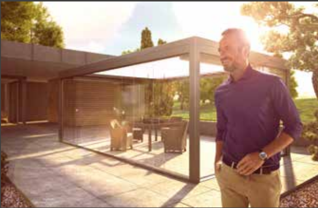
Schiebe-Systeme Sliding Systems