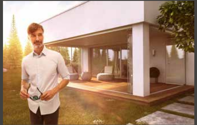
Schiebe-Dreh-Systeme Slide and Turn Systems